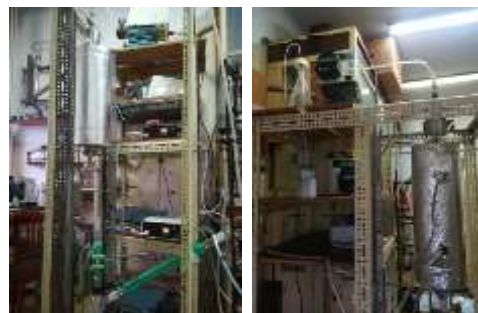
Instalacja do ciągłego otrzymywania kaprolaktamu w skali wielkolaboratoryjnej – węzeł reaktorowy